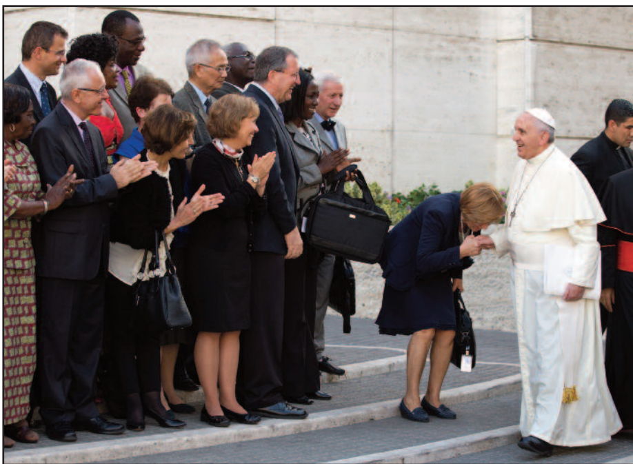
Встреча Папы Франциска с аудиторами Синода. 10 октября 2014 года.

Возник какой-то шум вокруг "Доклада после дискуссии". Нельзя забывать, что дискуссия в группах шла очень свободно, и не нужно воспринимать разные мнения как догматы. Есте-