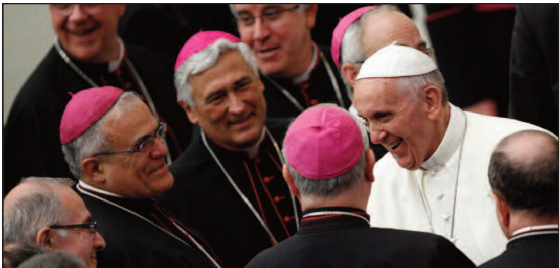
Папа Франциск с отцами Синода.

Но семья носит и сакраментальное измерение, семья – это тайна любви и Таинство, Таинство Брака, основанное на Крещении. Согласитесь, такой подход сильно отличается от других: ты прежде всего призван видеть, созерцать факт, знак, и только исходя из этого изучать и рассматривать возможности для того, чтобы разрешить проблемы и вопросы, омрачающие жизнь семьи. И здесь становится понятной роль свидетельства миссионерских семей, пример людей, которые не говорят: "Это