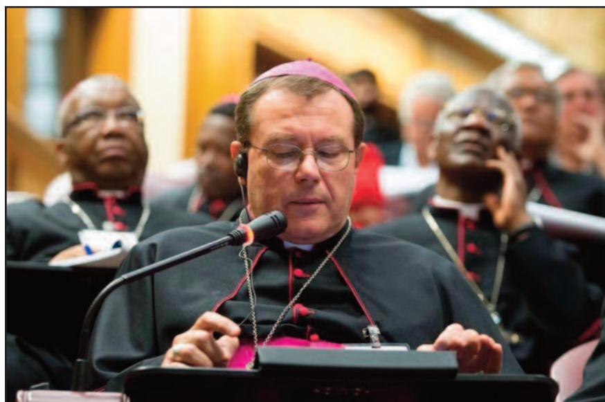
Архиепископ Павел Пецци выступает на заседании Синода епископов. 7 октября 2014 года.

Сегодня объявили, что с 4 по 25 октября следующего года состоится ординарная сессия Синода епископов на тему: «Призвание и миссия семьи в современном мире». Меня очень обрадовало, что Папа Франциск решил расширить тему, и теперь она действительно подчеркивает два, на мой взгляд, фундаментальных понятия, на которых основана прекрасная история взаимоотношений Церкви и семьи.