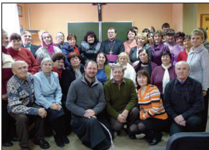
Встреча в приходе Благовещения в Озёрске.