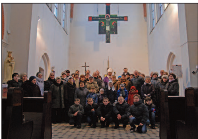
Встреча с прихожанами храма св. Бруно в Черняховске.

В этот же день архиепископ совершил Святую Мессу в храме Святого Бруно в