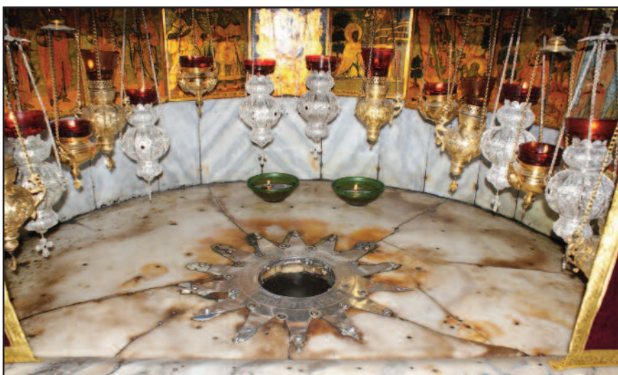
Место рождения Христа. Базилика Рождества Христова в Вифлееме

После того, как богатый юноша в ответ на призыв Христа — «пойди, продай имение твоё, и следуй за Мной» — отошёл с печалью, Христос на полный изумления вопрос учеников: «кто же может спастись?», ответил: «человекам это невозможно, Богу же всё возможно» (ср. Мф 19,22-26). →