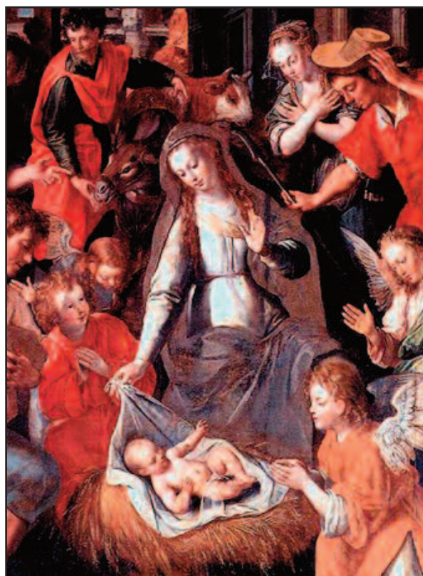
Мартин де Вос, Рождество Христово, 1577

«Бог верен» (ср. Втор 32,4; Рим 3,4) — и высшим проявлением этой верности стало Рождество Иисуса Христа в Вифлеемской пещере. Вся история мироздания — это история спасения, история Откровения милосердия и любви Бога к человеку. Вся история — это путь Бога навстречу человеку: «Любовью вечной Я возлюбил тебя», — говорит Господь Бог Своему народу и в то же время каждому человеку, — «и потому простёр к тебе благоволение» (ср. Иер 31,3). Бог никогда не устаёт делать первый шаг навстречу человеку, и даже если человек забывает о Нём, не → 2