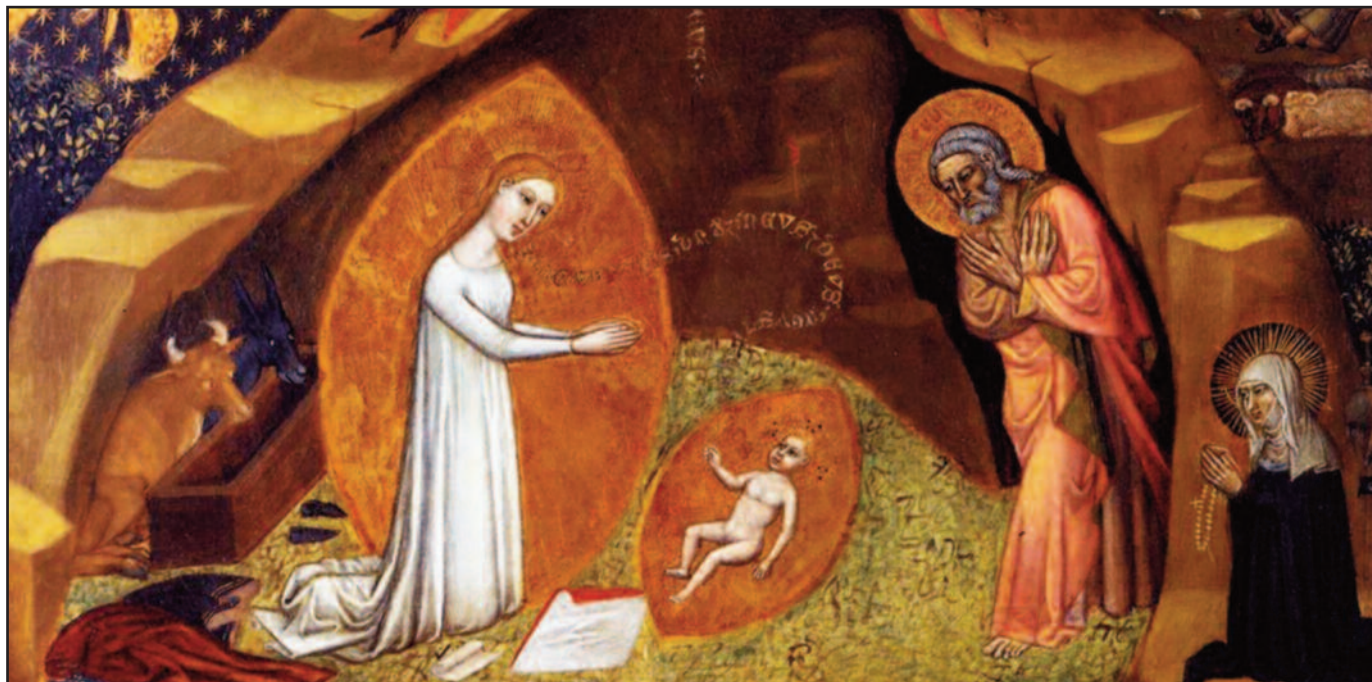
Никколо ди Томмазо, Видение Рождества св. Бригитте, ок. 1372

Пусть эта утешительная истина сопровождает каждого из вас, возлюбленные чада Божии, на вашем жизненном пути. Желаю всем вам, вашим родным и близким, вашим соседям и сослуживцам, всем нашим согражданам, и всем людям на Земле, чтобы ликование и мир Рождественской ночи входили в наши