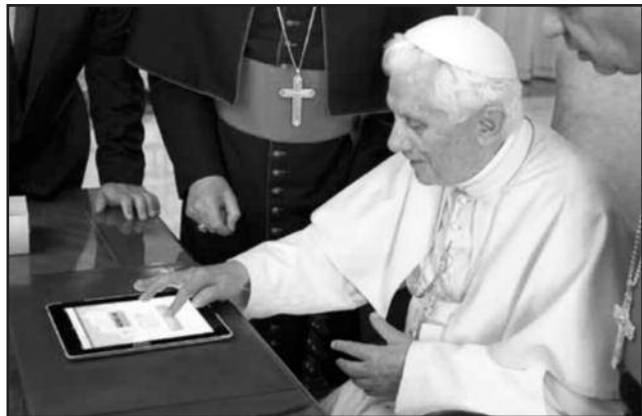
Папа Бенедикт XVI использует iPad, чтобы открыть ватиканский новостной портал www.news.va . 29 июня 2011 года.

Послание Святейшего Отца Бенедикта XVI на 46-й Всемирный день социальных коммуникаций