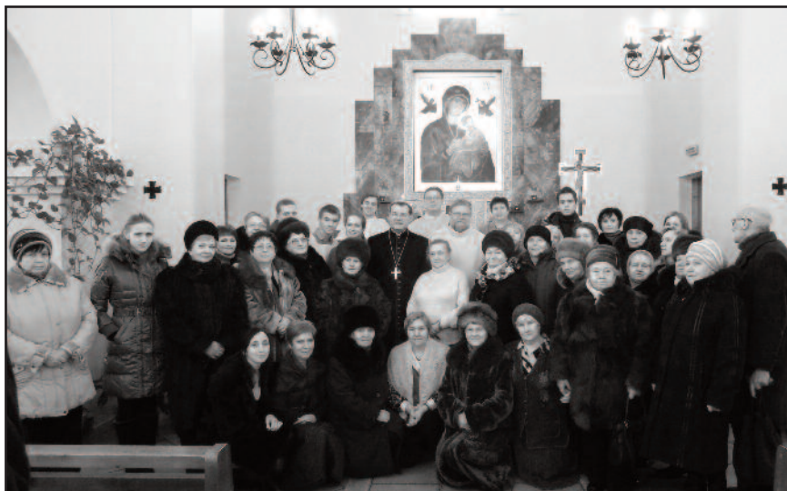
Встреча архиепископа с прихожанами