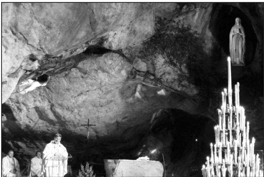
Благодарственная Святая Месса в Массабельском гроте в Лурде. 11 февраля 2012 года