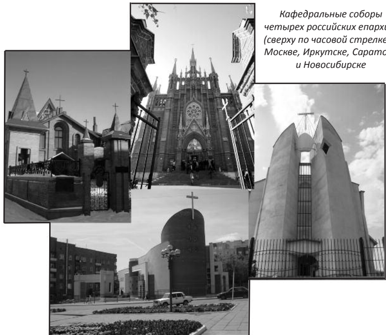
Кафедральные соборы четырех российских епархий: (сверху по часовой стрелке) в Москве, Иркутске, Саратове и Новосибирске