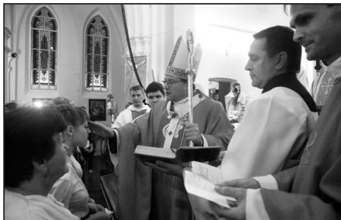
Таинство Миропомазания в приходе Успения Божией Матери в Курске.

Утром в воскресенье, 9 октября, архиепископ встретился с прихожанами и ответил на их вопросы о своем служении, о жизни Церкви и прихода, о молитве. Вновь обращаясь к прихожанам во время воскресной Мессы, архиепископ сказал: «Празднование 115-летия этого храма для нас – не воспоминание о прошлом, но «воспоминание» о событии, которое происходит сегодня, как и 115 лет назад, – о Трапезе Господней.