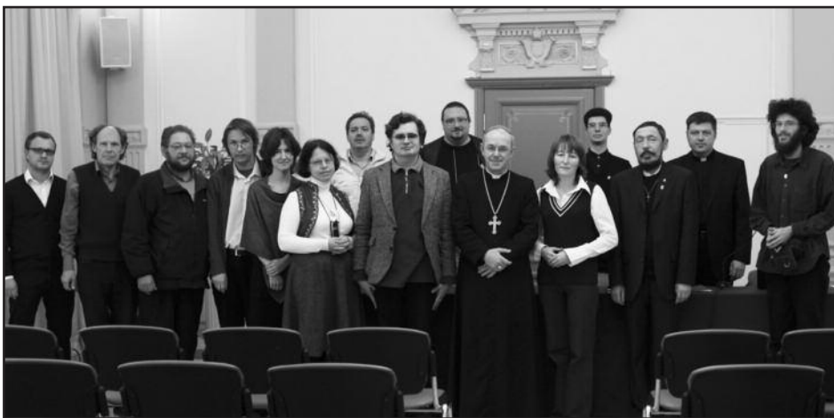
Организаторы и докладчики конференции «Католическая Церковь в СССР в 20-30-е гг.»

1926-1928 гг.; массовыми преследованиями, разрушением церквей отмечены и 1930-1931 гг., продолжила докладчица. Она упомянула о призыве Папы Пия XI, обращенном ко всему миру, встать на защиту верующих в России, однако это не