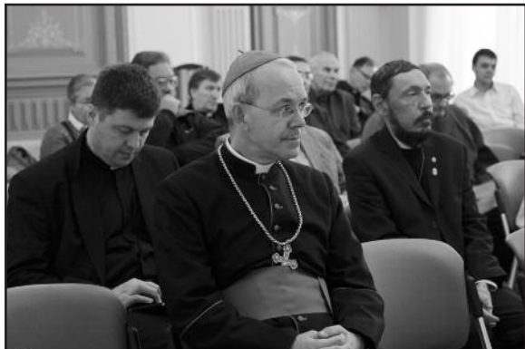
Епископ Атаназий Шнайдер

письмо Папы стало «пусковым механизмом», который «резко интенсифицировал» выступления западных держав в защиту верующих в СССР. Опираясь на новые архивные документы, историк показал, какие мощные силы с советской стороны были вовлечены в кампанию контрпропаганды, основанной на «круговой поруке лжи». Источники свидетель-