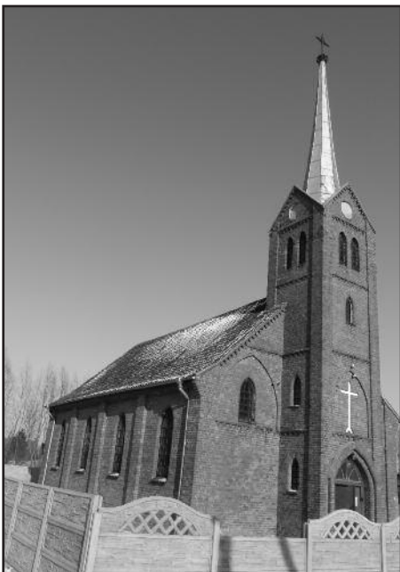
Храм Святого Иоанна Крестителя в Большаково

ными и удивительными приключениями» (Гомилия на праздник Крещения Господня, 10 января 2010 г.). Апостол Павел в своих посланиях неоднократно подчеркивает исключительную близость с Сыном Божиим, реализующуюся в этом погруже- → 3