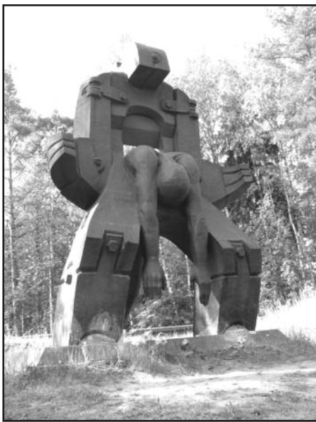
Монумент «Молох тоталитаризма» на Левашовском кладбище. Авторы: Н. Галицкая, В. Гамбаров.

католиков города на Неве. Больше всего денег было собрано прихожанами церкви св. Станислава, затем — прихода св. Екатерины, Посещения Пресв. Девы Марии, Успения Пресв. Девы Марии и св. Иоанна Крестителя в Пушкине. Определенную сумму на памятник передали также Духовная семинария «Мария — Царица апостолов», конвентуальные францисканцы, францисканцы-обсерванты, салезианцы и сестры Францисканки Марии. Недостающую сумму перечислил Фонд помощи