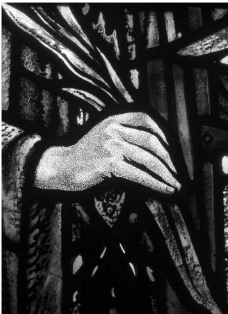
Рука мученика с пальмовой ветвью - символом победы над смертью. Фрагмент витража церкви св. Лаврентия в Энсли, Великобритания.

В качестве объединяющего начала творцы «нового мира» и «нового человечества», где не предусматривалось места для какой либо религии, кроме марксистских человеконена- →