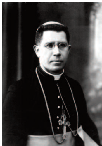
Слуга Божий архиепископ Мечисловас Рейнис