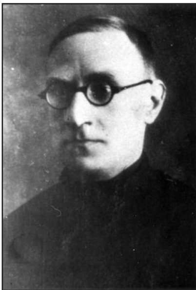
Священник Епифаний Акулов - один из сотен католических священников, погибших в годы репрессий. Расстрелян 27 августа 1937 г. Похоронен на Левашовской пустоши в Санкт-Петербурге.

В одной недавней публикации эта проблема была рассмотрена в свете начальных, дезавуированных и фальсифицированных позднее властью, результатов последней предвоенной переписи населения Советского Союза. Первоначально в →