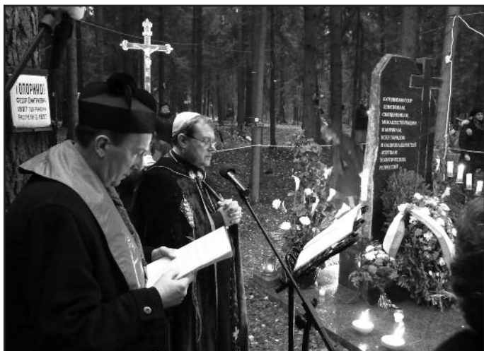
о. Кшиштоф Пожарский и архиепископ Павел Пецци во время богослужения освящения памятника католикам - жертвам репрессий на Левашовском мемориальном кладбище. 28 октября 2010 года.

Левашово сегодня — большой поселок в каких-нибудь 30 км от исторического центра Петербурга, местность к северу от города в направлении Выборга. За поселком находится аэродром, а рядом с ним, немного сбоку, за высоким зеленым деревянным забором вырос зеленый лес. Этот лес многие годы скрывал свою мрачную тайну, ставшую явной лишь в конце горбачевской перестройки. О том, что скрыто под разросшимися деревьями, общественность смогла узнать только в 1989 г. Здесь находились общие могилы 47 тыс. человек разного вероисповедания и национальности, расстрелянных во время сталинских репрессий 1937-1954 гг.