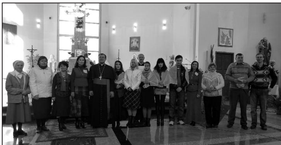
Архиепископ с настоятелем и прихожанами. 24 октября 2010 г.

Подготовлено с использованием материалов сайтов www.procatholic.ru и www.cathtv.narod.ru .