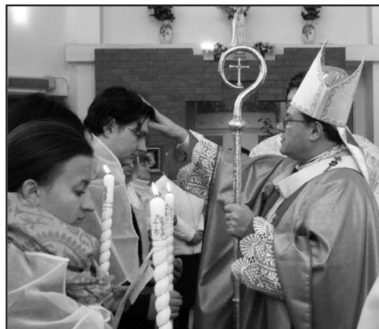
Таинство Миропомазания. 24 октября 2010 г.

рий с частицами мощей св. Фаустины Ковальской, полученными в дар 3 апреля 2003 г. от о. Яна Заяца, настоятеля святилища Божиего Милосердия в Кракове в Лагевниках.