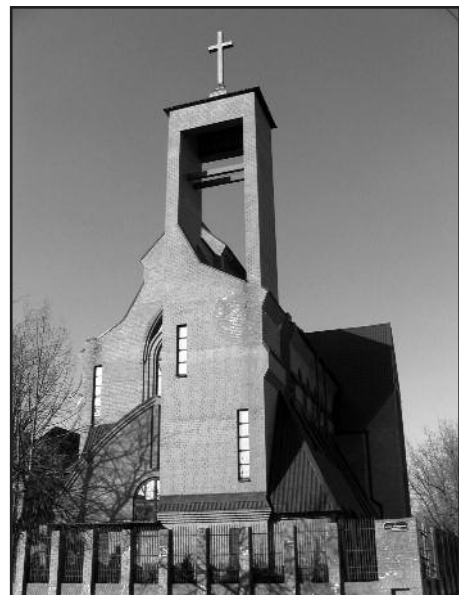
Храм Преображения Господнего в Твери. Архитектор - Алексей Жоголев

хода. Власти по-разному использовали здание бывшей церкви, и в 1974 г. оно было окончательно уничтожено. Сохранилось лишь здание приходского дома.