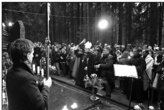
Освящение памятника. 28 октября 2010 года.

После получения соответствующих согласований: Комитета по градостроительству и архитектуре, Комитета экономического развития, промышленной политики, а также предприятия «Ритуальные услуги», можно было приступить к изготовлению памятника. Однако, последняя из перечисленных организаций потребовала, чтобы на памятнике не было никаких имен. Одновременно начался сбор средств на его установку среди петербургских прихожан, чтобы проект был общим делом