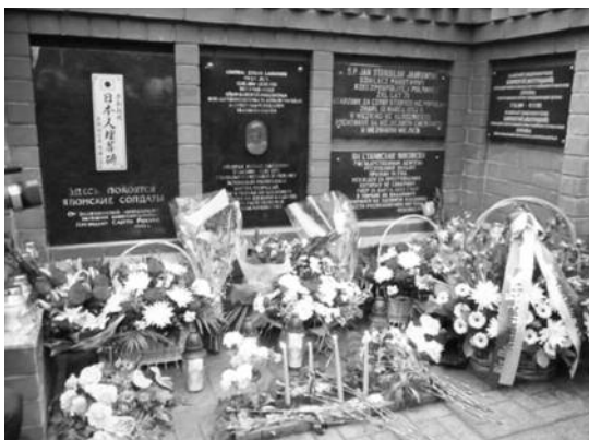
Мемориальные доски жертвам репрессий на Князь-Владимирском кладбище во Владимире