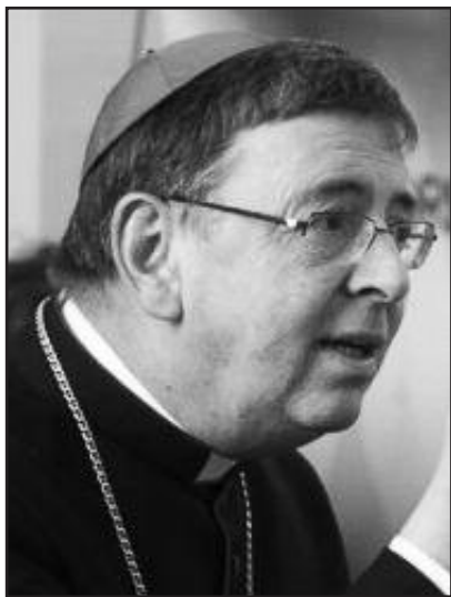
Архиепископ Курт Кох, председатель Папского совета по содействию христианскому единству.

Митрополит Иоанн (Зизиулас): «Не существует облаков недоверия между нашими двумя Церквями. Наши предшественники и, особенно, главы наших Церквей, как с католической, так и с православной стороны, подготовили путь к дружеской и братской дискуссии. Я должен заверить вас, что этот дух господствует во время наших дискуссий. И потому я хотел бы заверить вас, что если мы будем продолжать в том же духе, Бог найдет путь к преодолению всех оставшихся трудностей, и при-