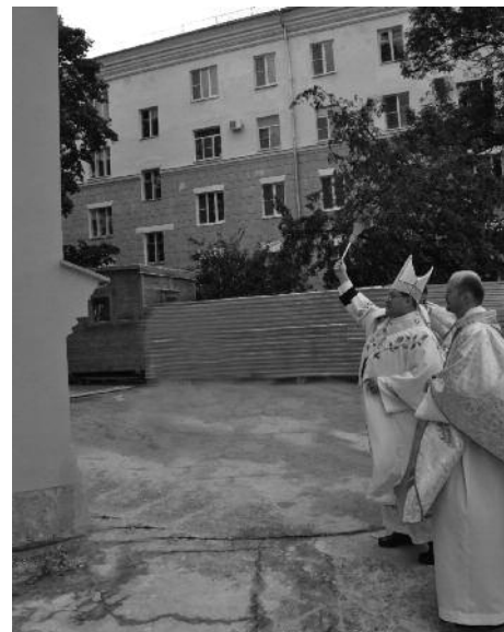
Освящение колоколен храма.

Впервые за много десятилетий площадь перед храмом огласилась звоном его колоколов – пока электронных, однако настоятель прихода надеется, что их место в