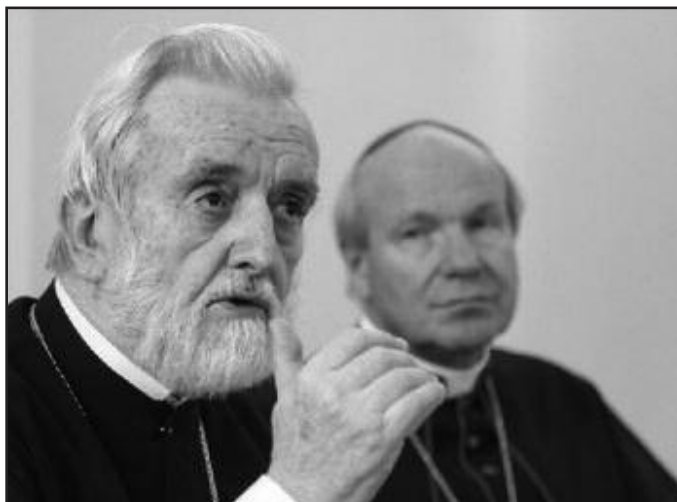
Митрополит Пергамский Иоанн (Зизиулас) и архиепископ Венский кардинал Кристоф Шёнборн.

Перевод материалов пресс-конференции: «Сибирская католическая газета»