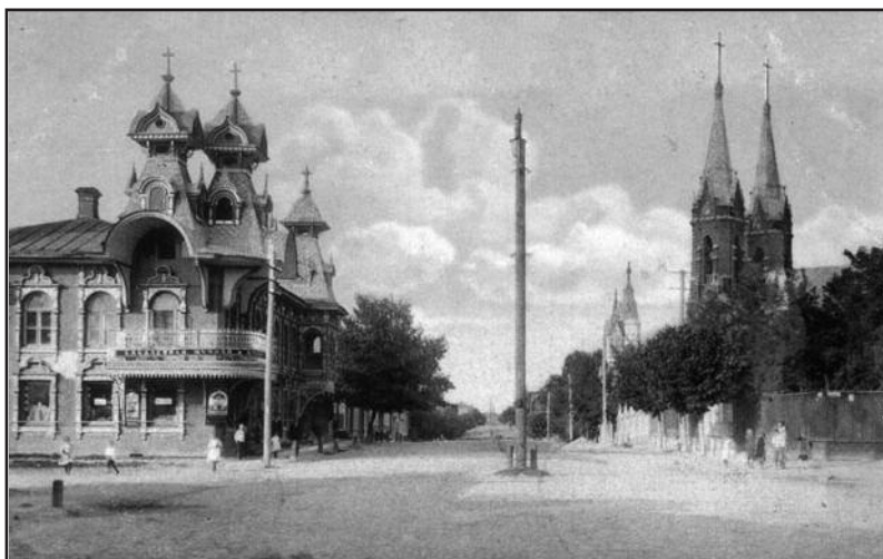
Пушкинская улица Рыбинска на открытке начала XX века. Справа - храм Святейшего Сердца Иисуса.

Там он был арестован в третий раз за участие «в создании антисоветской группировки, ведущей антисоветскую агитацию, тайно совершавшей богословские и религиозные обряды и осуществлявшей нелегальную связь с волей для передачи за границу сведений шпионского характера о положении католиков в СССР». В