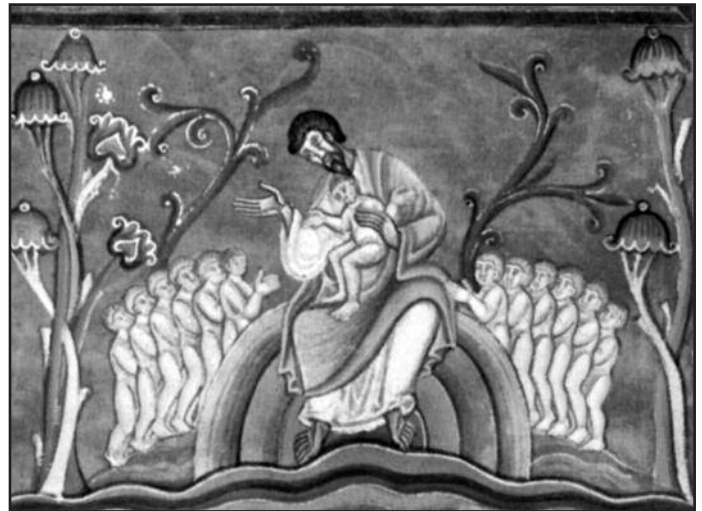
Притча о богаче и Лазаре: Лазарь на Лоне Авраамовом. Из "Золотого евангелия". Ок. 1035-1040 гг.

Притча о богаче и нищем, которую Лука рассказывает в своём Евангелии, углубляет вопрос о богатстве: кажется, что богатство этого мира не только обманывает человека своей иллюзией преходящего, эфемерного счастья; но подобное богатство де-