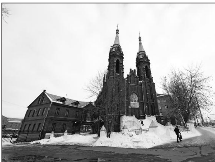
Храм Святейшего Сердца Иисуса - единственная католическая святыня в Верхнем Поволжье - остается студенческим клубом.

По материалам архивных данных и материалов, доступных в сети Интернет