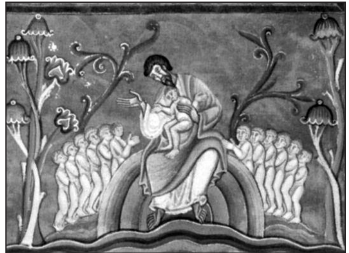
Притча о богаче и Лазаре: Лазарь на Лоне Авраамовом. Из "Золотого евангелиария". Ок. 1035-1040 гг.

Притча о богаче и нищем, которую Лука рассказывает в своём Евангелии, углубляет вопрос о богатстве: кажется, что богатство этого мира не только обманывает человека своей иллюзией преходящего, эфемерного счастья; но подобное богатство де-