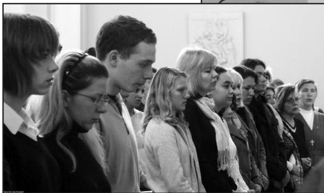
26 сентября 2010 года. Принятие в катехуменат.

Попросим Богородицу сопровождать нас в пути, который предстоит нам в этом году. Попросим Приснодеву Марию помочь нам жить достойно величию той человечности, в которой мы были сотворены.