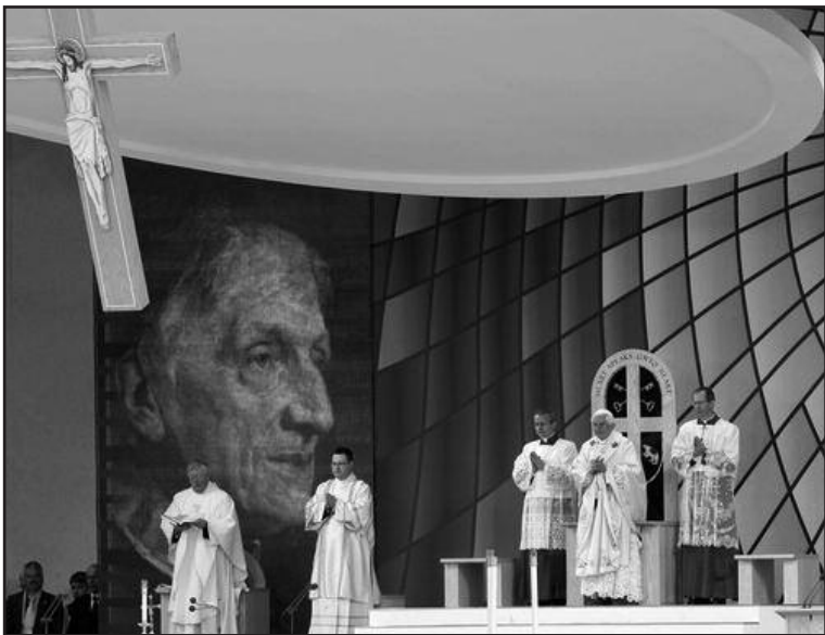
Месса беатификации. 19 сентября 2010 г., Кофтон-Парк, Бирмингем, Англия.

боте по единству Церкви и роли самой Церкви в мире, соответствующей его заботам и вызовам,- все это нашло место в работе Собора. Голос Ньюмена оказался пророческим, он вел истинным духом Собора.