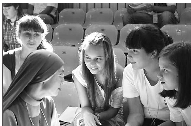
Момент обсуждения в группах