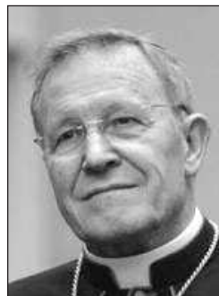
Кард. Вальтер Каспер

Это первый визит архиепископа Илариона после назначения его главой Отдела внешних церковных связей РПЦ МП, заменившего митрополита Кирилла, нынешнего Патриарха Московского и всея Руси. «После многочисленных встреч и бесед в прошлом с Патриархом — подчеркивают в Папском совете по содействию христианскому единству — этот визит станет подтверждением дружественных отношений