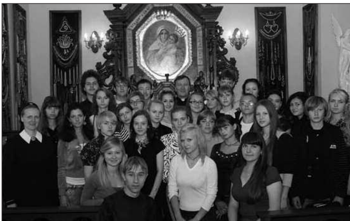
Молодежь у иконы Матери Божией Трижды Предивной