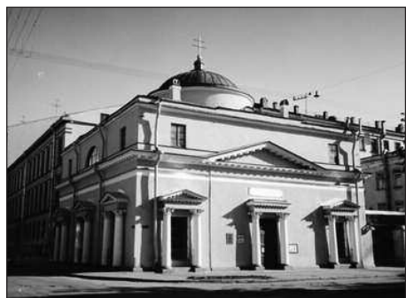
Храм св. Станислава в Санкт-Петербурге