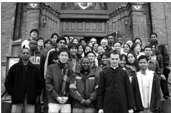
Прихожане курского прихода со своим настоятелем