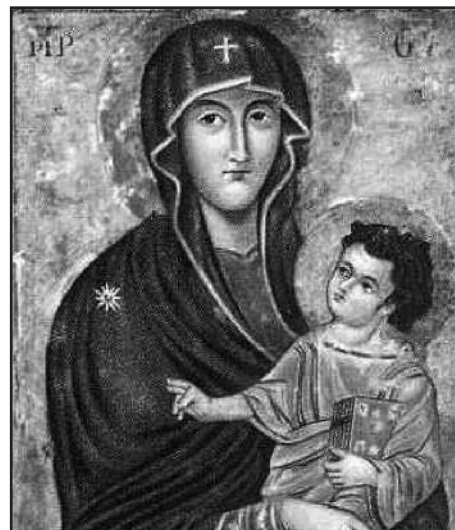
Фрагмент образа Богородицы «Спасение римского народа», хранящегося в базилике Санта Мария Маджоре в Риме.

ные студенты, – воспитывать пастырей, принадлежащих к различным Церквям Центральной и Восточной Европы в духе любви к наследию восточного, и особым образом русского христианства, и в совместном стремлении к единству.