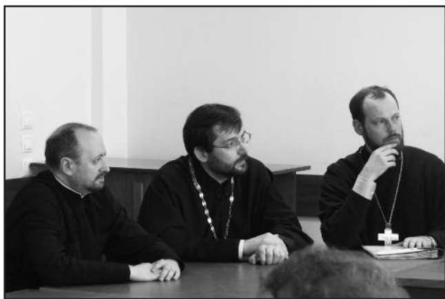
Сотрудники ОВЦС участвуют в пастырской встрече священников Архиепархии Божией Матери в Москве

2 июня 2010 г. в здании курии католической архиепархии Божией Матери в Москве прошла очередная встреча Совместной рабочей группы по рассмотрению проблем в отношениях между Русской Православной и Римско-Католической Церквами в России.