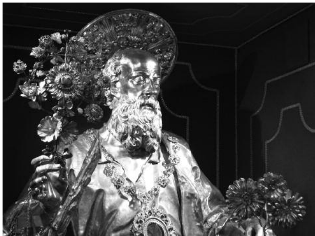
Реликвиарий с частицами креста св. апостола Андрея Первозванного в Кафедральном соборе Амальфи