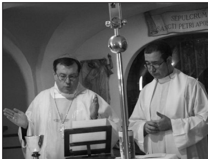
Святая Месса у гроба св. апостола Петра в гротах базилики св. Петра, 25 мая 2010

признать, что в нём мы находим опору для нашей веры, для нашего служения. Он, который есть Пастырь по образу Христа, пусть своим примером, своей проповедью, своей жизнью укрепляет наше пастырское служение.