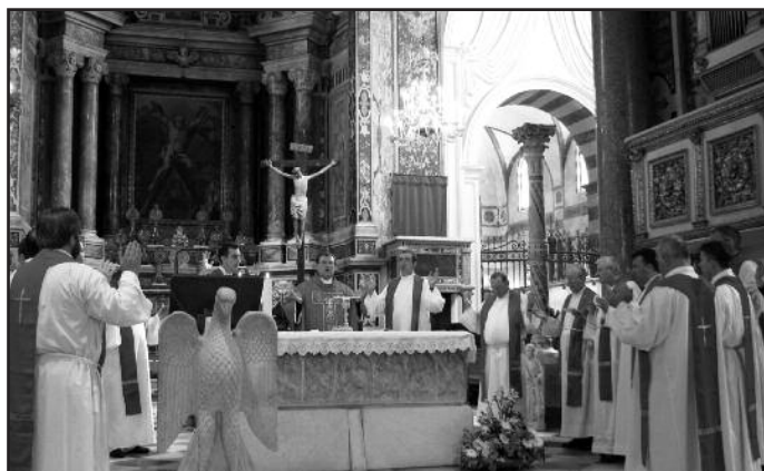
Святая Месса у мощей св. апостола Андрея Первозванного в Кафедральном соборе Амальфи, 27 мая 2010

тельность Церкви. В беседе со священниками, несущими служение в России, кардинал – один из старейших сотрудников римской курии – размышлял о природе священства, о вызовах, которые ставит перед священниками современная ситуация в Церкви и мире, о своем опыте взаимодействия с движениями в Церкви, об отношениях с Православием. → 3