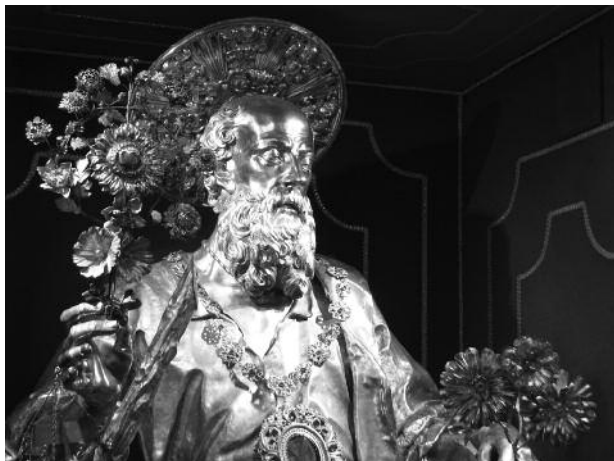
Реликварий с частицами креста св. апостола Андрея Первозванного в Кафедральном соборе Амальфи