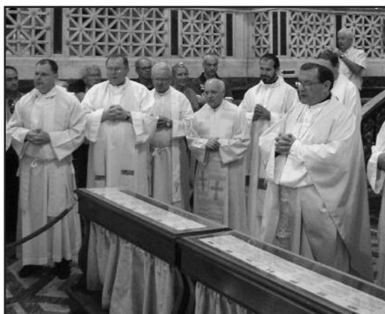
Молитва у мощей св. апостола Павла, Рим, базилика св. Павла вне стен, 26 мая 2010

Во время короткой беседы, состоявшейся в конце аудиенции, архиепископ