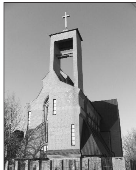
Храм Преображения Господня в Твери. Построен в 1994-2002 гг. Освящен 2 февраля 2003 года.