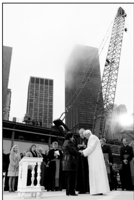
20 апреля 2008 года: посещение мемориала на месте, где находились «башни-близнецы» Всемирного торгового центра. Нью-Йорк, США.

В декабре Папа побывал в Турции, где встретился с Вселенским Патриархом Варфоломеем I, с которым подписал совместную декларацию.