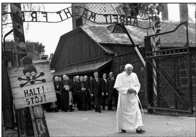
28 мая 2006 года: посещение мемориала на месте концентрационного лагеря Освенцим-Биржанау, Польша.

Затем Святейший Отец провозгласил Год празднования таинства священства, который завершится в июне 2010 года. Этот