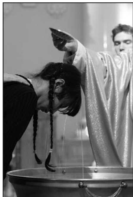
Крещение в латинском обряде.

Однако факт реальной жизненной встречи со Христом в Церкви, практикующей иной обряд, отличной от обряда крещения (например, в латинском обряде для православных хри-