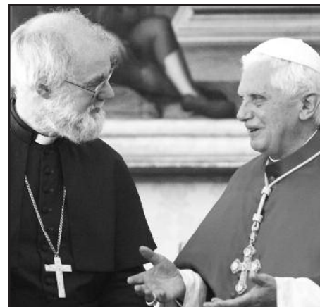
11 ноября 2009 года: встреча с Архиепископом Кентерберийским Роуэном Уильямсом.