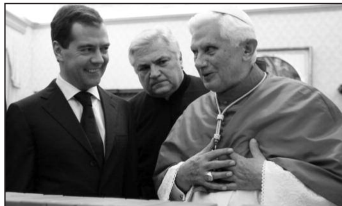
3 декабря 2009 года: встреча с Президентом России Дмитрием Медведевым.

Перевод Информационной службы Архиепархии Божией Матери в Москве