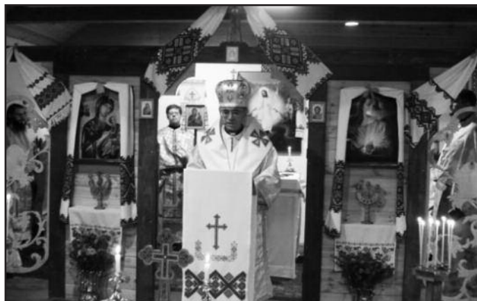
Литургию совершает Ординарий для католиков византийского обряда в России епископ Иосиф Верт.

Поскольку катехизацией называется передача веры при подготовке к крещению, невозможно здесь говорить о катехизации в собственном смысле слова. С другой стороны, очевидно, что само решение о вступлении в полное общение с Католической Церковью должно быть осознанным — не только для того, кто об этом просит, но и для самой Церкви. Общине Церкви должно быть ясно, что христианин, просящий о полном общении, понимает, что такое Церковь, и что с его стороны это не сиюминутное решение. Общение именно предоставляется, в него принимают, и это значит, что недостаточно только желания, но нужно и активное действие другой стороны. Таким образом, то, что в данном случае привычно называют «катехизацией», на самом деле является периодом ознакомления с учением Католической Церкви, знакомства с католической общиной как таковой, чтобы человек ясно видел, куда он идет. Весь этот период направлен на обеспечение большей свободы в принятии решения о присоединении.