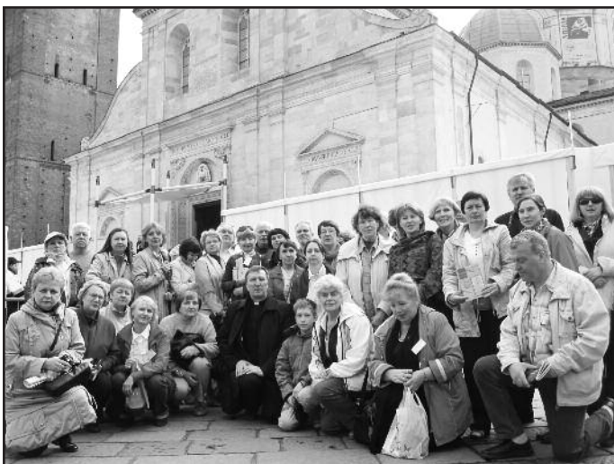
Российские паломники перед Кафедральным собором Турина.

был распят Иисус Христос. Мы получили благословение Святым Крестом, которое помогло нам преодолеть трудный путь.