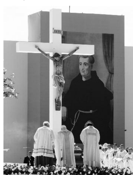
11 мая 2007 года: торжественная Месса в честь канонизации блаженного Антониу Гальвана (1739-1822) - первого святого представителя коренного населения Бразилии.

Еще одна беспрецедентная публикация вышла всего несколько недель назад: это Послание Церкви в Ирландии в связи с фактами сексуального насилия над детьми со стороны священников. Этот документ стал плодом встречи Святейшего Отца с ирландскими епископами для исследования ситуации и ее причин, а также обсуждения мер, направленных на недопущение повторения подобных случаев в будущем.