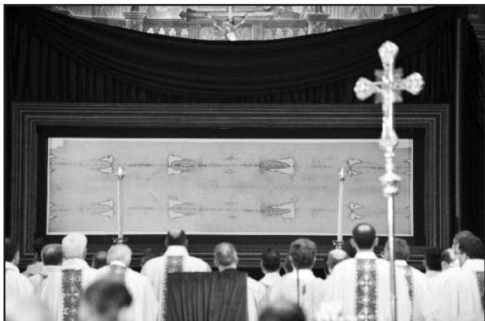
Торжественное богослужение в честь начала выставления Туринской Плащаницы. 10 апреля 2010 г.

150 тысяч. Сердце замирает в ожидании встречи с Христом. Прекрасная организация и атмосфера этого события позволяет сосредоточиться на самых сокровенных мыслях. Мы входим в храм. Невидимая рука Господа подводит нас к самой святыне, и мы оказываемся в первом ряду большого количества разноязычных паломников. Перед нами Плащаница со следами страданий Христа. Наши чувства невозможно описать: это и радость