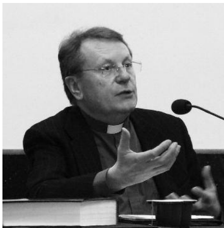
Свящ. Манлио Соди, SDB

9-10 марта в Москве прошел организованный архиепархией Божией Матери в Москве симпозиум «Литургия и пастырство», главным докладчиком на котором выступил один из наиболее влиятельных современных католических литургистов, президент Папской богословской академии, профессор Папского салецианского университета в Риме свящ. Манлио Соди, SDB.