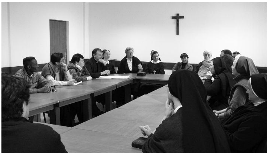
Момент дискуссии в малых группах

Литургической комиссии при Конференции католических епископов России, размышлял об истории и нынешнем состоянии процесса формирования аутентичной литургической лексики Католической Церкви в России. Процесс этот в России, по понятным причинам, начался относительно недавно, и проходил,