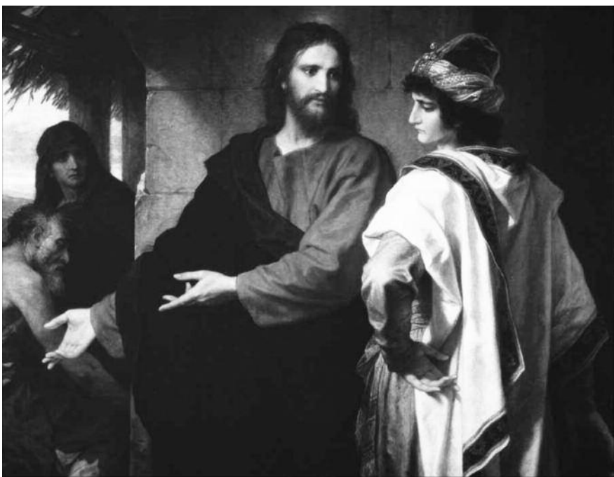
Генрих Гоффман, Христос и богатый юноша, 1889 г.

Богатый юноша спрашивает Иисуса: «Что мне делать?» Этап жизни, который вы теперь переживаете, — это время открытий: даров, которыми Бог с избытком наделил вас, и своей ответственности. Кроме того, это время, когда принимаются решения, на которых будет основан план вашей дальнейшей жизни. Поэтому именно теперь нужно спросить себя о подлинном смысле жизни, спросить себя: «Доволен ли я своей жизнью? Чего мне недостает?»