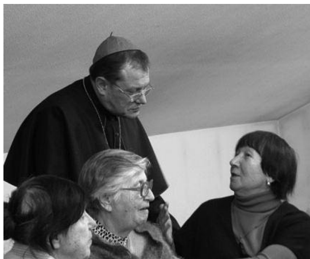
Встреча с прихожанами в Нижнем Новгороде. Январь 2010

– Не думаю. Этот вопрос является актуальным по всему миру, не только здесь. Скажем, основы веры в общем являются сегодня настолько неперезжитыми, что требуют прежде всего укрепления. Я советовал, когда стал ректором, сопровождать богословие изучением обычного Катехизиса. В некоторых семинариях на Западе это дало большие успехи. Надо заложить хороший фундамент, чтобы на нем строить здание.