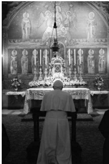
Папа Бенедикт XVI молится в часовне Богородицы Улования во время визита в Папскую римскую семинарию

Отсюда возникает второй смысл: вино – это символ, выражение радости любви. Господь сотворил Свой народ, чтобы тот ответил на Его любовь. Образ виноградной лозы, виноградника, таким образом,