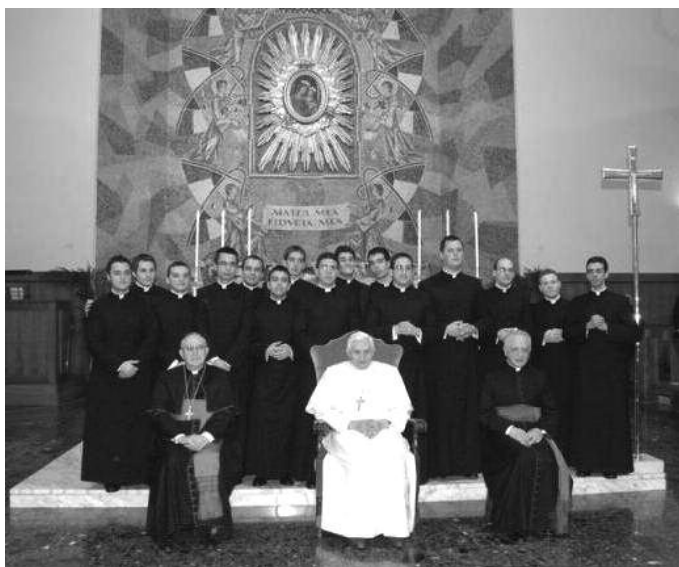
Папа Бенедикт XVI с руководством и первокурсниками Папской римской высшей духовной семинарии.

Если мы продолжим внимательно читать этот отрывок, то обнаружим и второй призыв: «пребудьте», и ещё: «если заповеди Мои соблюдёте».