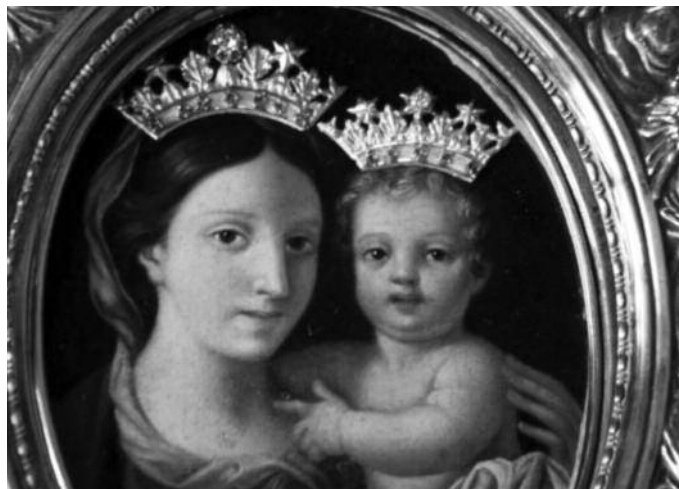
Богородица Упования - покровительница Папской римской высшей духовной семинарии.

нам Себя, дал нам Духа, и благодаря этому мы смогли ответить на требования жизни и помочь другим в их страдании. Конечно, Иисус научил нас молитве «Отче наш». Мы можем молиться о многом. Во всех наших нуждах мы можем молиться: «Помоги мне!» Это совершенно по-человечески, и Бог, как мы видели, тоже человек; поэтому будет верно просить Бога в молитве о малых вещах, связанных с нашей повседневной жизнью.