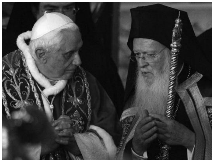
Папа Бенедикт XVI и Патриарх Константинопольский Варфоломей

В апостольском послании « Orientalis Lumen » Иоанн Павел II утверждает: «Нас уже соединяет чрезвычайно тесная