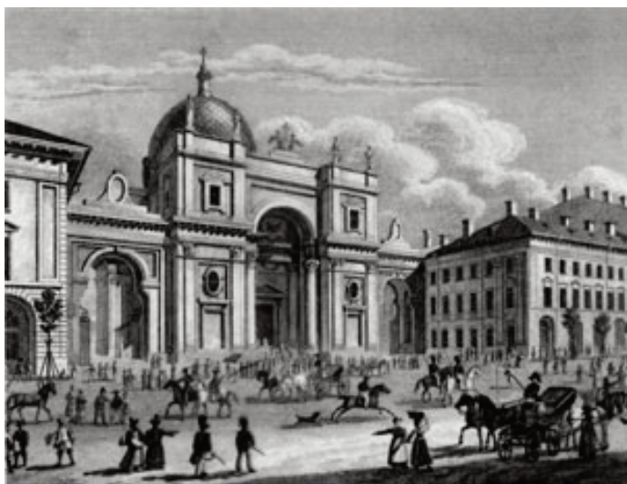
Храм св. Екатерины Александрийской в Санкт-Петербурге в XIX в.

Итак, не было недостатка в контактах с Римской Церковью и в её присутствии на территории Киевской Руси. При этом следует признать, что Московская Русь никогда не состояла в единстве с Римом и со своего зарождения не проявляла особого интереса к установлению отношений с Католической Церковью. [Позже, в Российской империи] Католическую Церковь в России рассматривали и терпели как Церковь для иностранцев. Именно этот статус обеспечивал католикам более или менее мирное существование с Русской Православной Церковью.