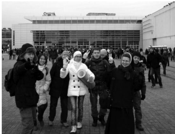
Паломники из прихода Успения Божией Матери в Нижнем Новгороде на встрече Тезе в Познани

Встреча Тезе поразила меня, прежде всего, огромным количеством участников. Тысячи и тысячи людей из самых разных стран приехали, чтобы провести время с Богом. Особенно тронули меня