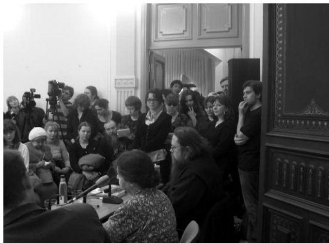
Встреча в Культурном центре «Покровские ворота» («Духовная библиотека»)

В заключение ещё раз процитирую Иоанна Павла II: «Грех нашего разделения — тяжелейший: я вижу, сколь необходимо, чтобы возростала наша общая чуткость к Духу, Который призы-