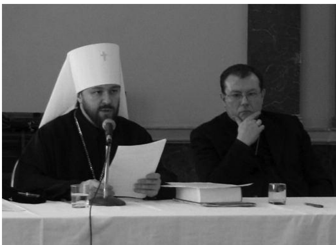
Митрополит Иларион (Алфеев) и архиепископ Павел Пецци - председатели Христианского межконфессионального консультативного комитета стран СНГ и Балтии, 4 февраля 2010.

Нельзя любить того, чего не знаешь. А узнать можно лишь то, с чем живёшь бок о бок. «Нужно узнать душу разделённых братьев», – говорит II Ватиканский собор. Вот возможные пути к этой цели: знакомиться с литургией восточной Церкви; глубже исследовать духовные предания Отцов христианского Востока; изучать благовестие восточной Церкви и сопоставлять его с католическим; сглаживать неизбежное напряжение между «латинством» и «византийством»; организовывать и стимулировать диалог между богословами, историками, специалистами по литургии и каноническому праву, которые, в свою очередь, могут распространять знания о Восточных Церквях; на семинарах и на богословских факультетах обеспечивать надлежащее преподавание этих предметов, особенно для будущих священников.