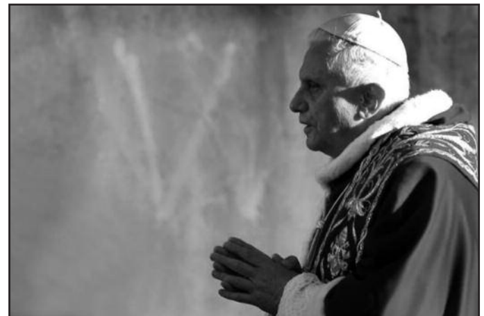
Папа Бенедикт XVI возглавляет богослужение Пепельной среды в базилике св. Сабины в Риме

Для начала я посвящаю несколько строк собственному значению слова «справедливость», которое в повседневной речи указывает на требование «воздавать каждому то, что ему причитается» – по латыни « dare cuique suum », в соответствии со знаменитой формулой римского юриста III столетия Ульпиана.