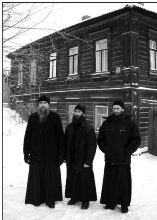
Монахи-студиты у дома, где прошёл последний год жизни блаж. Леонида Фёдорова