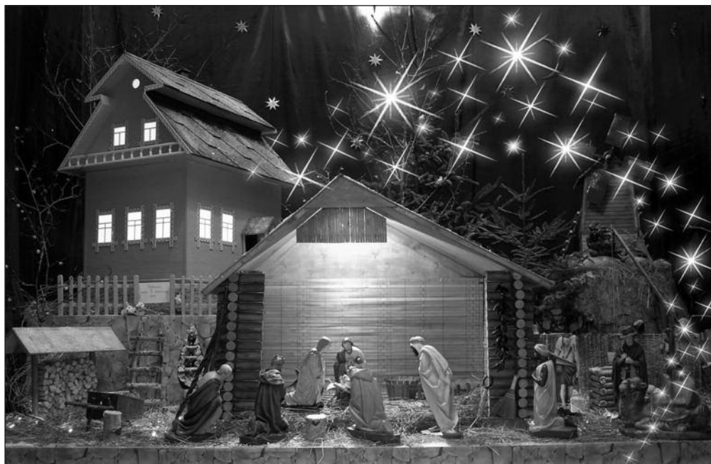
Рождественский вертеп, приход Св. Иоанна Крестителя, г. Пушкин

свобождают из глубины этого «я» желание видимым образом выразить и распространить в обществе это единство как величайшее благо для человечества на его пути к счастью.