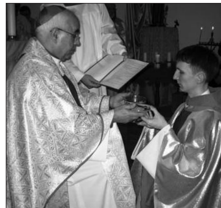
Обряд рукоположения: вручение чаши и патены

6 декабря неопресвитер отслужил свою первую Святую Мессу в храме св. Антония Чудотворца.