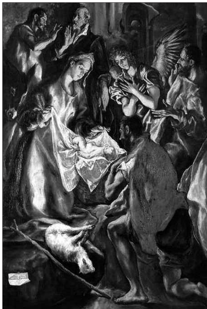
Эль Греко, Рождество

Непрерывность присутствия этого события в мире и в истории обеспечивает людской поток, во главе которого — Сам Христос. Это — Его тело, Церковь, действующая в истории, где божественное является через человеческое, где повторяется событие Христа.