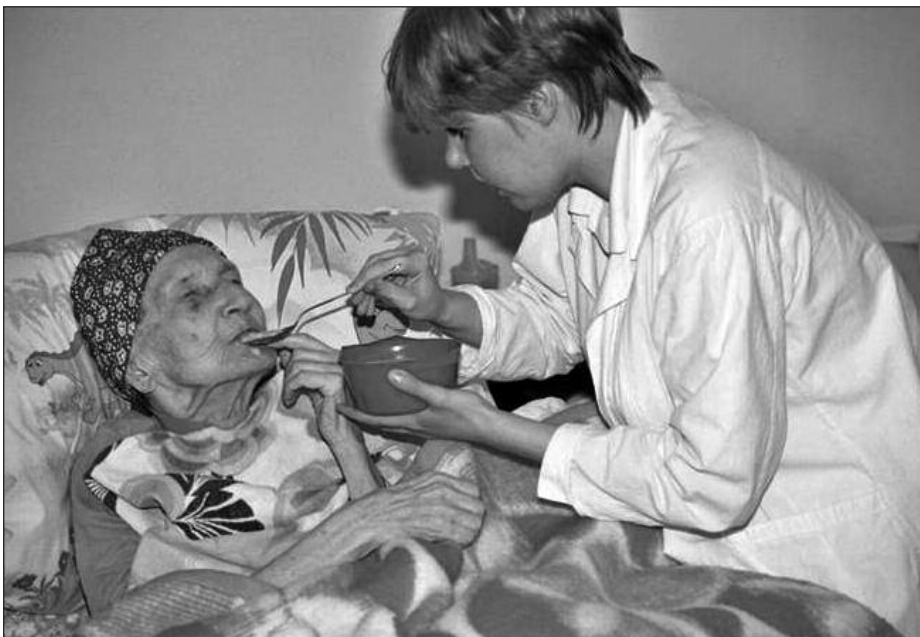
Дом престарелых, г. Санкт-Петербург

→ сирот и содействие их интеграции в общество. С этими детьми, которые после пятилетнего возраста оказываются в обычном детдоме, работает психолог, проводится культурная программа. Несколько детей удалось пристроить в приемные семьи. В «Каритас» Санкт-Петербурга с 2003 г. ведется работа по оказанию помощи ВИЧ-инфицированным людям. В настоящий момент проект работает в 4 направлениях: патронаж больных СПИДом в больницах и хосписах, паллиативная помощь ВИЧ-инфицированным людям (в т.ч. и на дому), группа взаимопомощи для женщин, больных СПИДом, профилактическая работа.