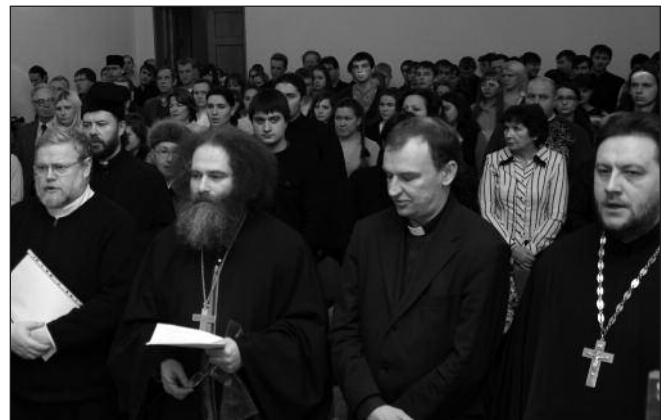
Участники «Покровских чтений»

Вместе с докладчиками слушатели прошли своеобразный путь от древнего Иеру-