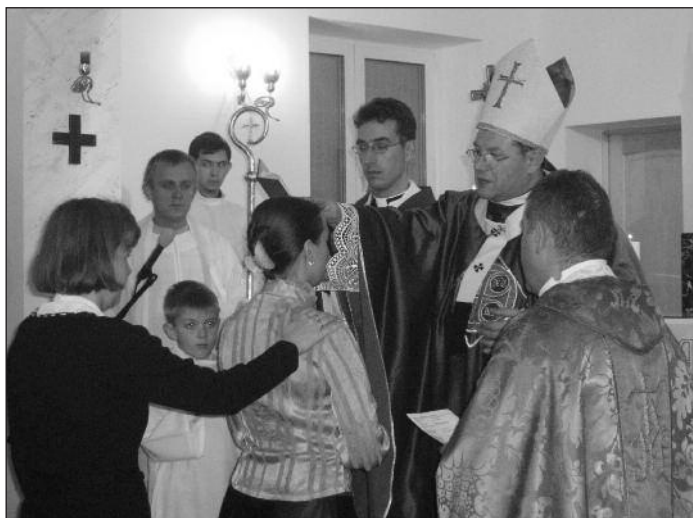
Архиепископ Павел Пецци преподает таинство миропомазания в курском приходе

В воскресенье после мессы в Орловском храме архиепископ посетил Брянск. После отъезда предыдущего настоятеля воскрес-