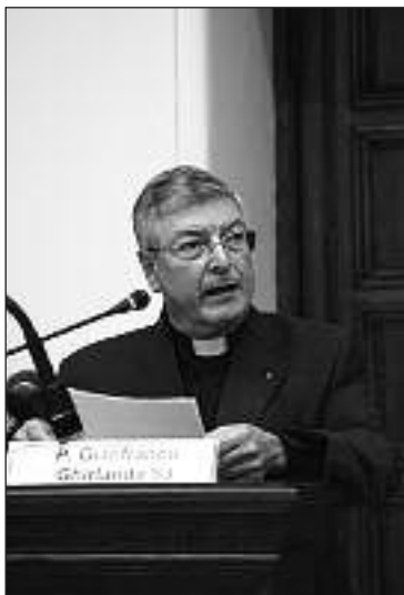
О. Джанфранко Гирланда

сывает, что для бывших англикан, перешедших в католицизм, будут созданы специальные структуры, Персональные ординариаты, в юридическом отношении уподобленные существующим с 1986 года Военным ординариатам.