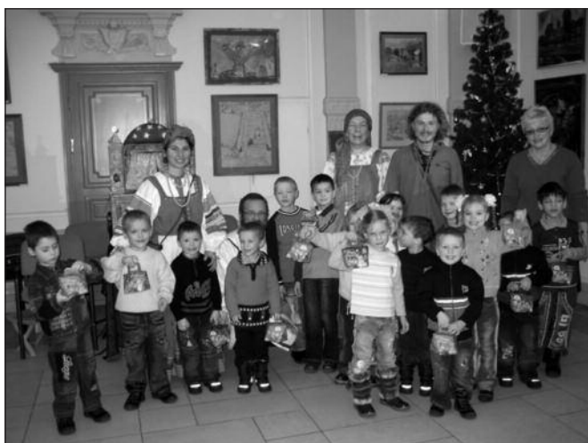
Программа «Детский СПИД», г. Москва

В помощи нуждаются и те, кто сам призван помогать заключенным — в частности, психологи, работающие в тюрьмах. Для них «Каритас-Запад» в Калининградской области совместно со шведскими специалистами организует мероприятия, встречи, круглые столы. Работают семинары для предотвращения «профессионального выгорания» сотрудников исправительных учреждений — этот проект чрезвычайно актуален и востребован. Еще одна область, где важно участие христианской благотворительности — это помощь ВИЧ-инфицированным и больным СПИДом. В «Каритас» Центрального региона работает проект «Детский СПИД», направленный на улучшение жизненной ситуации ВИЧ-позитивных детей- → 5