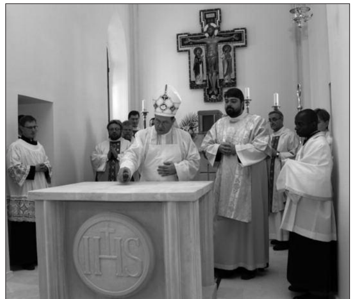
Архиепископ Павел Пецци освящает алтарь во владимирском храме

В тот же день архиепископ Павел посетил приход Вознесения Господня в Иваново. Небольшой, но дружный приход, который был зарегистрирован в 1999 г., с 2002 г. собирается в квартире-часовне. Здесь вме-