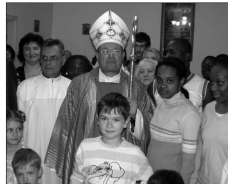
Архиепископ Павел Пецци с прихожанами ивановского прихода

ствует, что это нечто чужое, хотя мы никогда не скрываем, что это — католический храм». Настоятель также отметил, что как бы ни было ценно само по себе обновление интерьера храма, важнее то, что со-