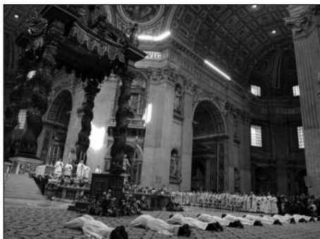
Папа Бенедикт XVI рукополагает священников в соборе Св. Петра в Риме