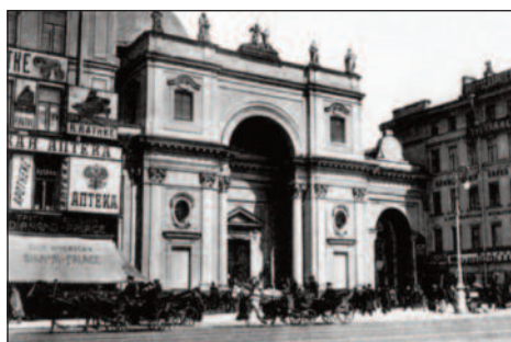
Храм Св. Екатерины в Санкт-Петербурге в дореволюционное время

В 1883 власти согласились освободить ссыльного епископа: ему был разрешен выезд за границу, но запрещено возвращение в Варшаву. В обмен Ватикан освободил Фелинского от должности главы варшавской архиепархии и назначил его титулярным епископом Тарсийским. Побывав в Риме, где он был принят Святейшим Отцом, Фелинский поселился в