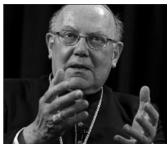
Кардинал Уильям Левада, префект Конгрегации вероучения

мере необходимости после консультации с местными Епископскими Конференциями. Их структуры будут аналогичны структурам Военных Ординариатов, существующих во многих странах мира для пастырского окормления военнослужащих и их родственников. «Англикане, которые обратились к Святому Престолу, ясно выразили свое стремление к полному и зримому присоединению к единой, святой, вселенской и апостольской Церкви. В то же время, они отметили, что для блага