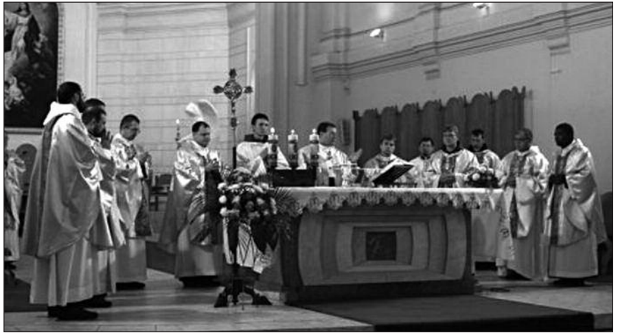
Месса открытия учебного года