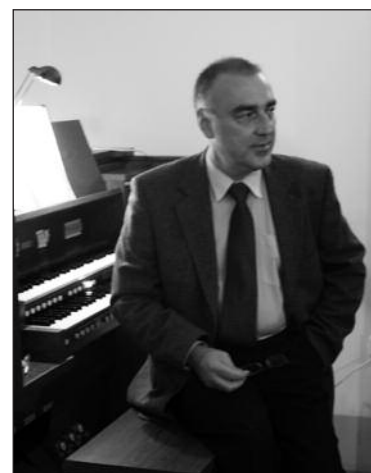
Уроки органного мастерства

Пока этот курс — единственный в России. Такие предметы, как церковный орган, формы григорианского хора, методика работы с григорианским хором, литургический аккомпанемент, история григорианского хора ни в одном российском ВУЗе не изучаются. Второе важное достоинство курса — возможность изучать на русском языке предметы, связанные с церковной музыкой. Для тех, кто не владеет свободно каким-либо западноевропейским языком, это единственная возможность получить знания по данным предметам. Надеюсь, что наш труд по систематическому переводу базовых изданий по истории и теории григорианского хора, истории церковной музыки, и другим пока не читаемым в России предметам, внесет свою скромную лепту в развитие образования в нашей стране.