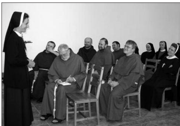
Работа в группах во время ассамблеи

Пресс-центр Российской Кустодии св. Франциска Ассизского