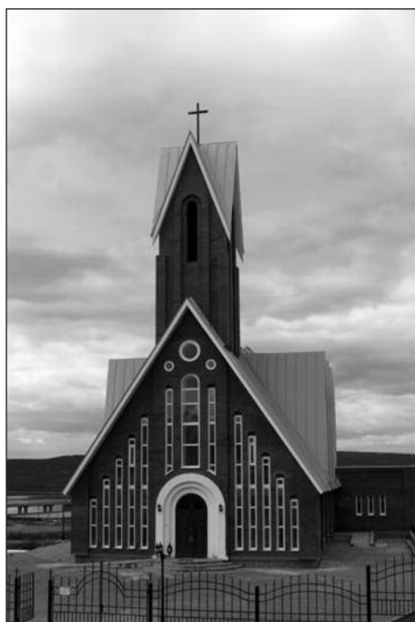
Храм Св. Михаила Архангела в Мурманске