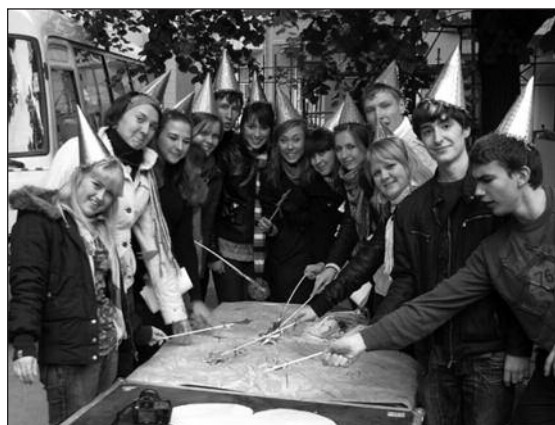
Праздник для детей у памятника доктору Гаазу